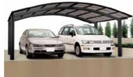
M-Ausführung (Gesamtbreite: 5423 mm)