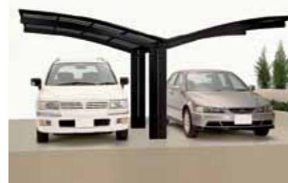
Y-Ausführung (Gesamtbreite: 5428 mm)

Artikelnummer/Farbe: (bezogen auf die Standardgrößen)