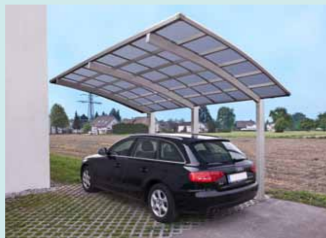
Portoforte 170 Edelstahllook