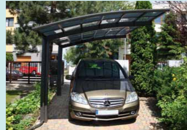
Portoforte 110 Sepiagrau