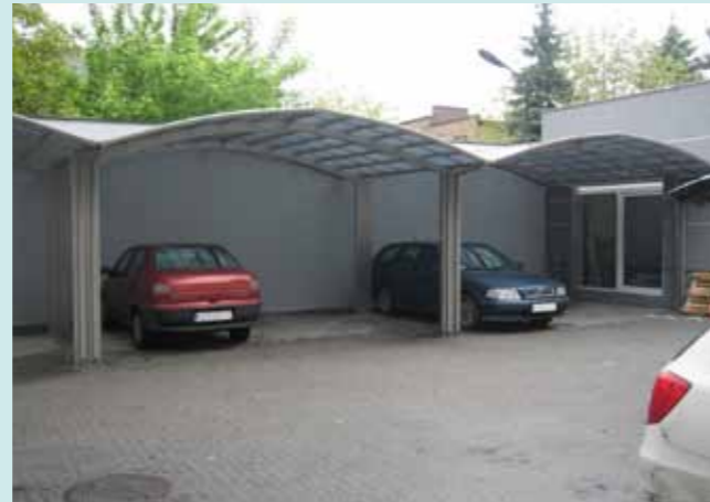
Portoforte 110 M-Version Edelstahllook