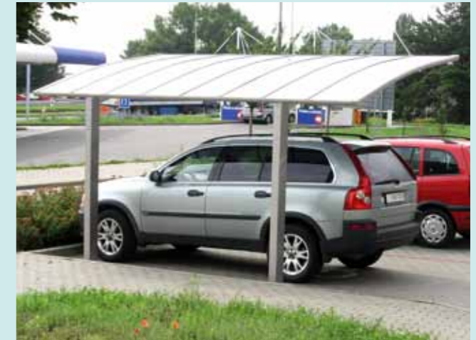
Portoforte 110 Edelstahllook