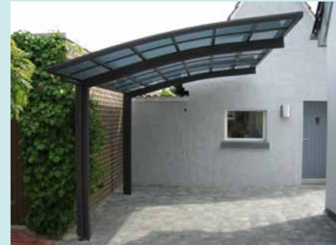
Portoforte 110 Sepiagrau