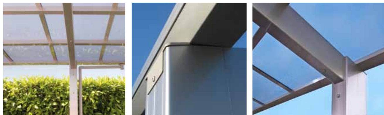
Beste Verarbeitung bis ins Detail zeichnen dieses qualitativ hochwertige Produkt aus.