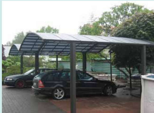
Portoforte 110 M-Version Sepiagrau