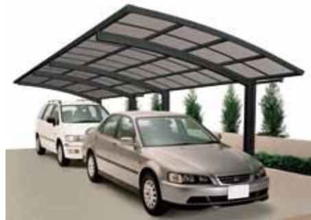
Tandem-Ausführung (Gesamtlänge: 9826 mm)