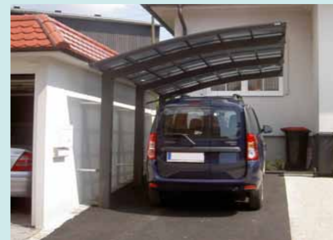
Portoforte 170 Sepiagrau