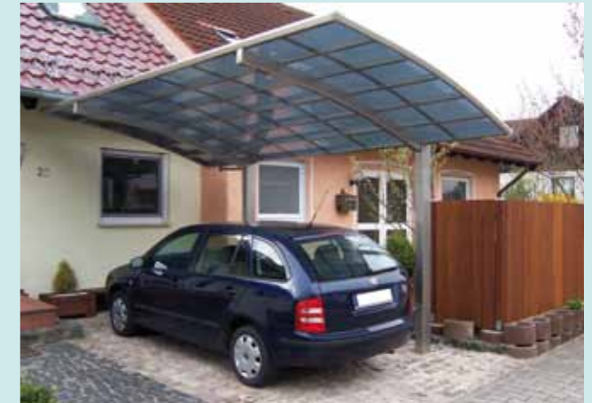
Portoforte 110 Edelstahllook