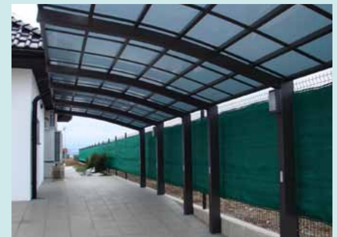
Portoforte 170 Tandem-Version Sepiagrau