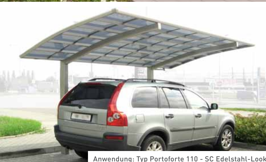
Anwendung: Typ Portoforte 110 - SC Edelstahl-Look