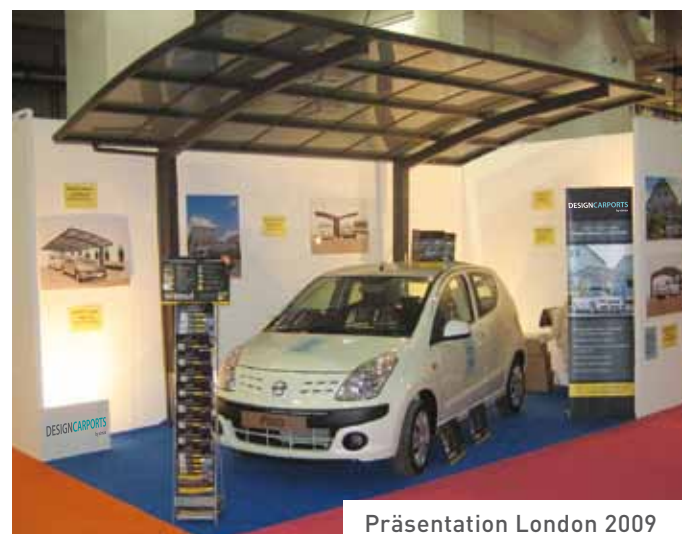
Präsentation London 2009