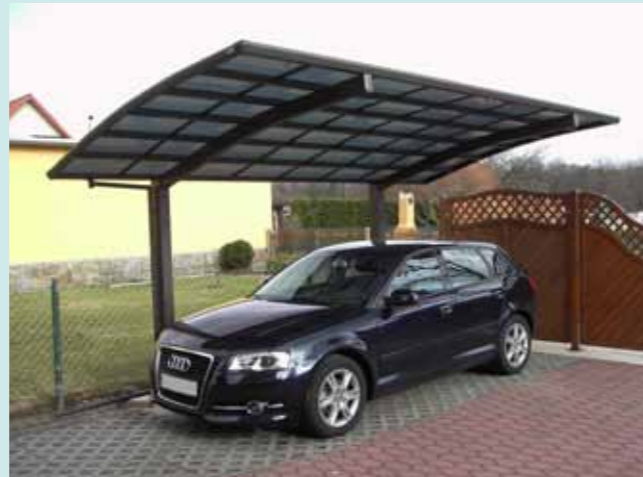
Portoforte 110 Sepiagrau