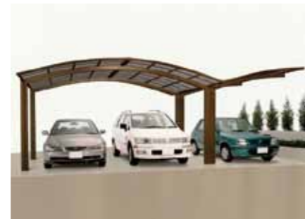
My-Ausführung (Gesamtbreite: 8146 mm)