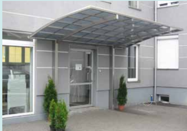
Portoforte 110 Edelstahllook