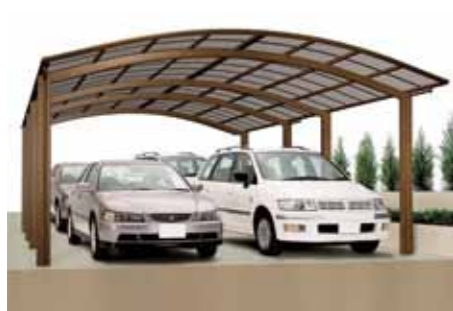
Multiple-Ausführung (Gesamtbreite: 5423 mm)