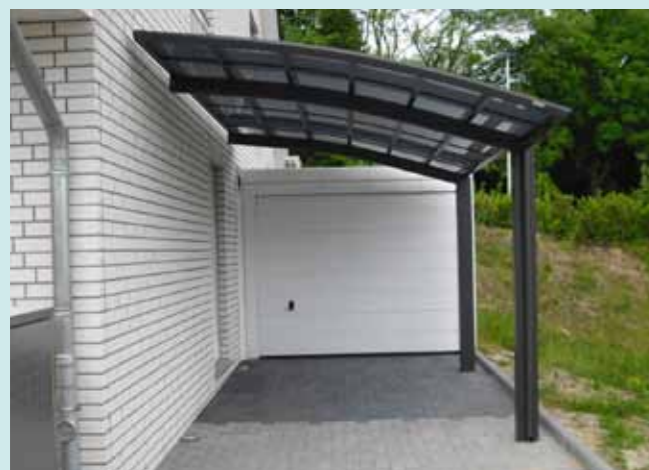
Portoforte 110 Sepiagrau